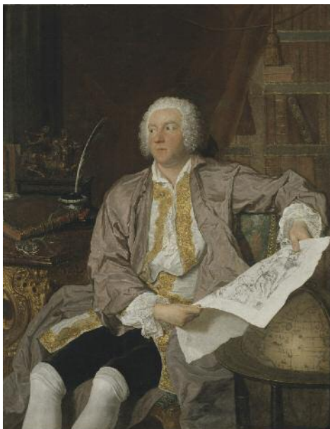
Greve Carl Gustav Tessin Konstnär: Jacques-André-Joseph Aved, fransk, född 1702 död 1766