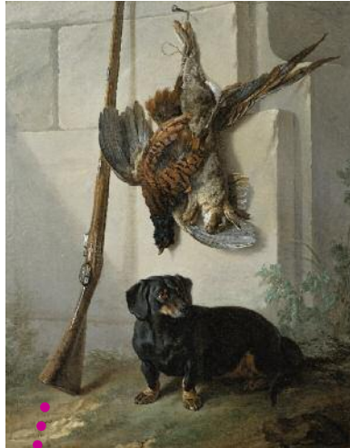
2. Taxen Pehr