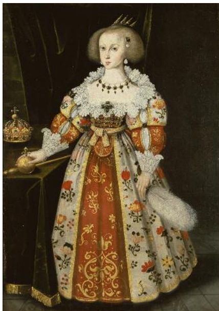
Drottning Kristina som barn Konstnär: Jacob Heinrich Elbfas. svensk, född ca 1600 död 1664