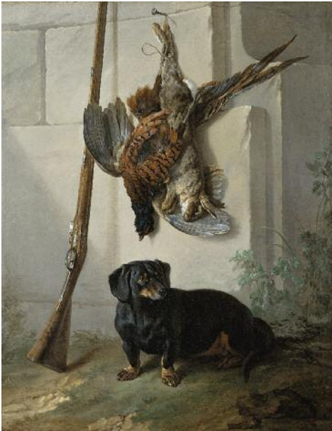
Taxen Pehr , 1740 Konstnär: Jean Baptiste Oudry, fransk född 1686 död 1755