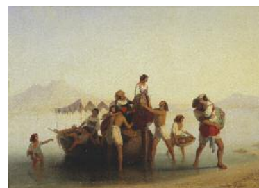
6. Egron Lundgren Neapolitanska fruktförsäljare Tillfälligt nedtagen