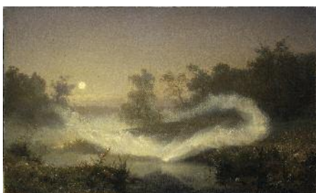
4. August Malmström Älvalek Tillfälligt nedtagen

Samlingar av måleri och skulptur från renässans till tidigt 1900-tal