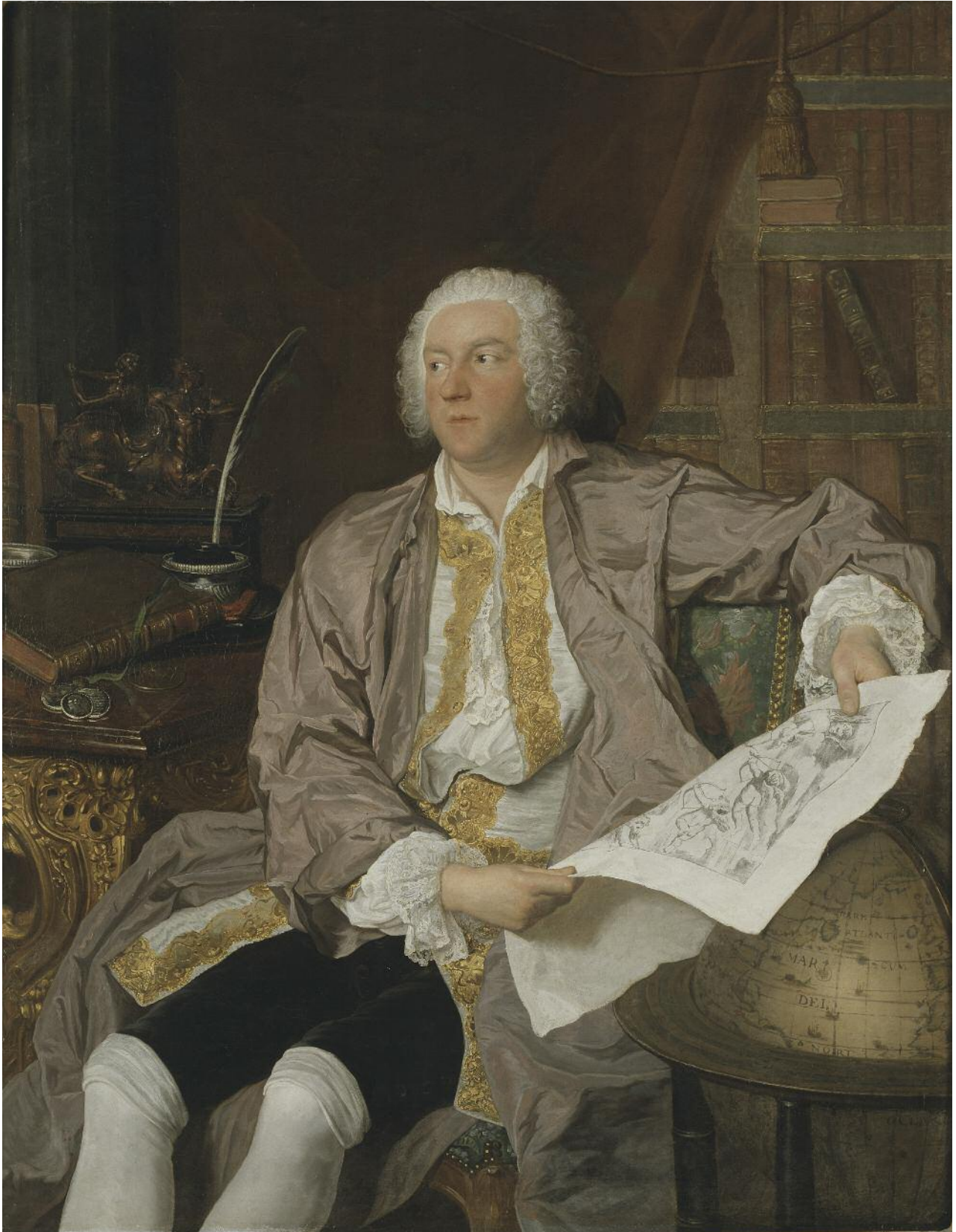
Jacques-André-Joseph Aved, Greve Carl Gustaf Tessin