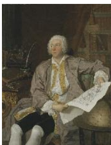
Jaques-André-Joseph Aved, fransk, (1702–1766) Porträtt av Greve Carl-Gustav Tessin, 1740

I det här porträttet möter vi en av huvudpersonerna i det svenska kulturlivet och politiken vid mitten av 1700-talet, Carl-Gustav Tessin. Han var diplomat och stor konstsamlare och son till slottsarkitekten och stadsplaneraren Nicodemus Tessin d.y.