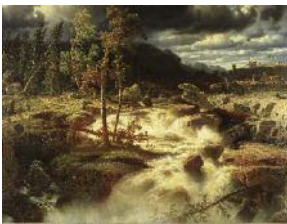
Marcus Larson, svensk, (1825–1864) Vattenfall i Småland, 1856

Mörka moln drar fram över himlen. Vinden viner genom trädkronorna och forsens vatten vräker fram över stenar och utskjutande klippblock. Inga levande varelser syns till men deras existens antyds – i stigar, fäbodrar och genom den lilla byns solbelysta klockstapel i bakgrunden till höger. Men i det här landskapet är människans tillvaro definitivt underordnad naturens starka krafter.