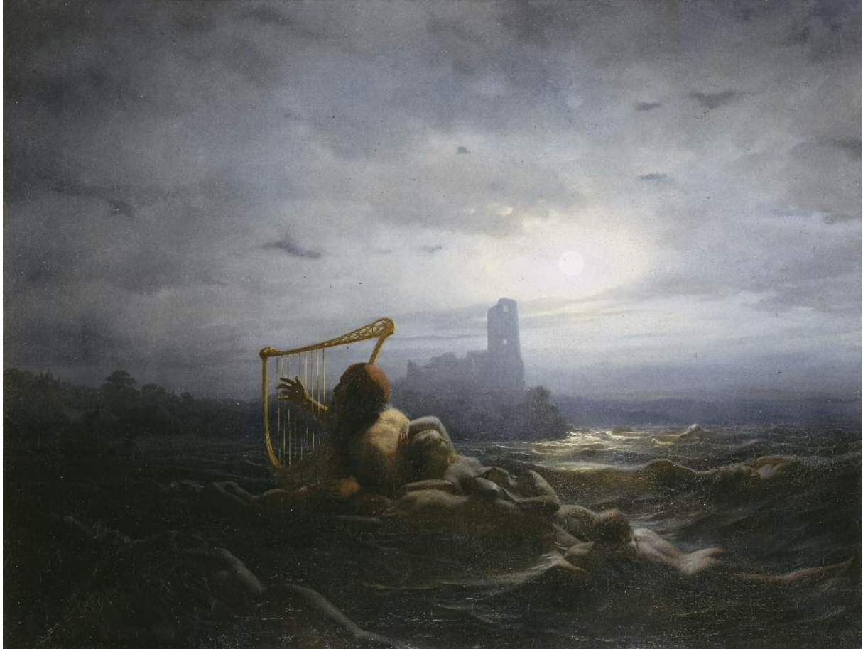
Nils Johan Olsson Blommér, Näcken och Ägirs döttrar